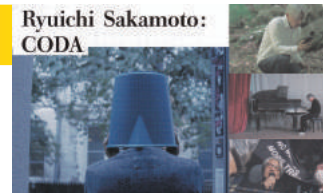
Ryuichi Sakamoto: CODA

2012年から5年の長きに渡る密着取材によって実現したドキュメンタリー作品が、満を持して全国公開します。角川シネマ有楽町、YEBIS GARDEN CINEMA 他、ぜひ映画館に足をお運びいただき、坂本龍一の音楽と思索の旅を捉えたドキュメンタリーをご堪能ください。